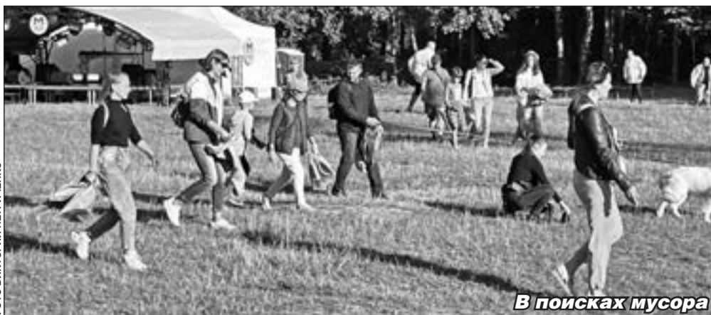
В поисках мусора