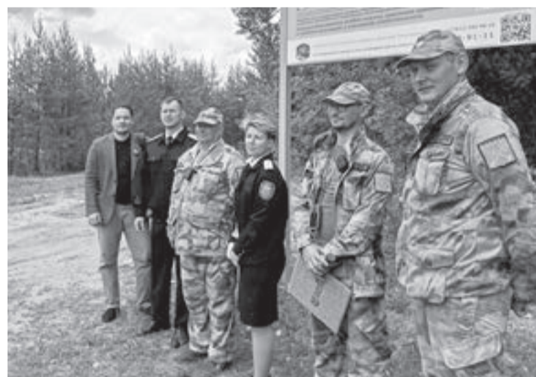
Госэконадзор регулярно проводит рейды на территории особо охраняемых природных зон

Услышав о полиции, компания присмирела. Одна из девушек подошла, извинилась и пообещала в скором времени удалиться восвояси. Всё-таки никому не нужны серьёзные проблемы с законом.