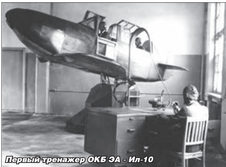
Первый тренажер ОКБ ЭА - Ил-10