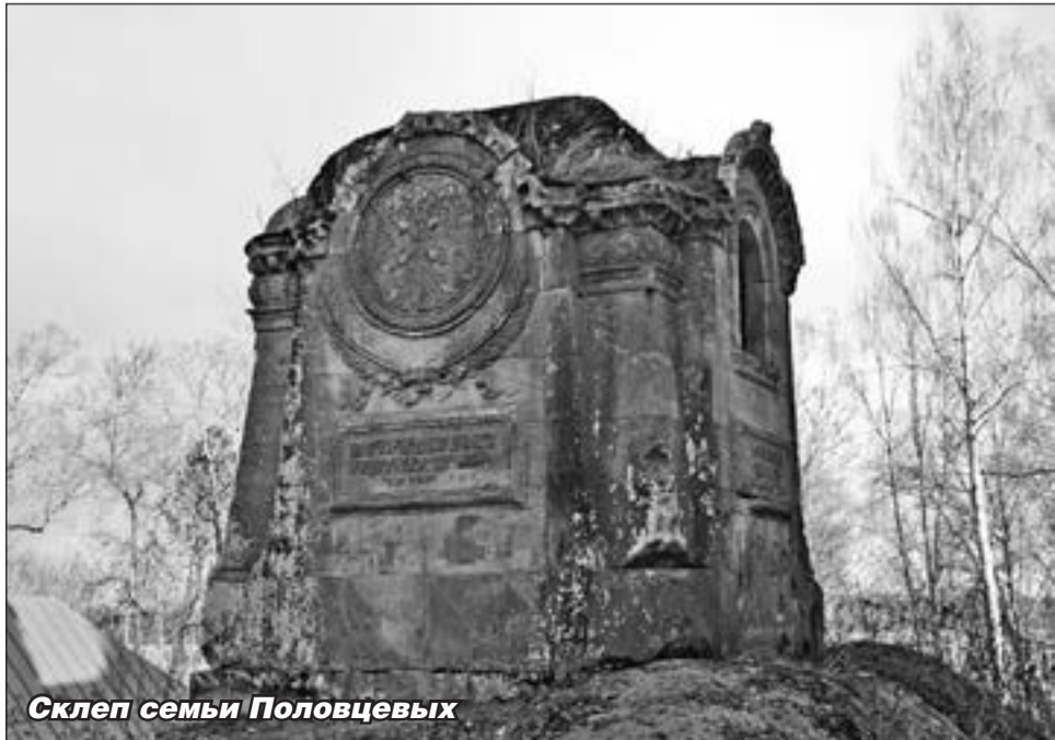
Склеп семьи Половцовых

Дай Бог, что обитель достигнет своего дореволюционного уровня и будет достойна славы Северного Патмоса.