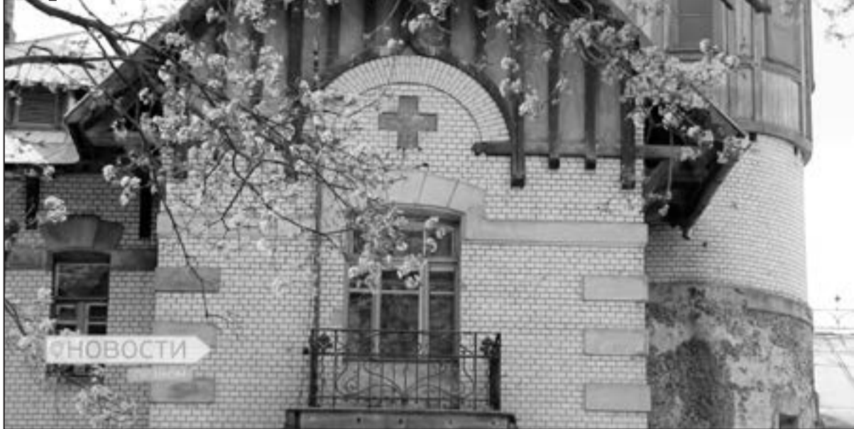
Онкологическая больница, построенная до революции

роньей. Воронья и Ореховая горы рядом, очень близко, так что их иногда и не различают. Между ними маленький перевал, улица Нагорная. Они почти как единое целое, а гора Киргоф все-таки отдельно. И перед ней — деревни с финно-угорскими названиями: Перекуля, Ретселя, Пикколово.