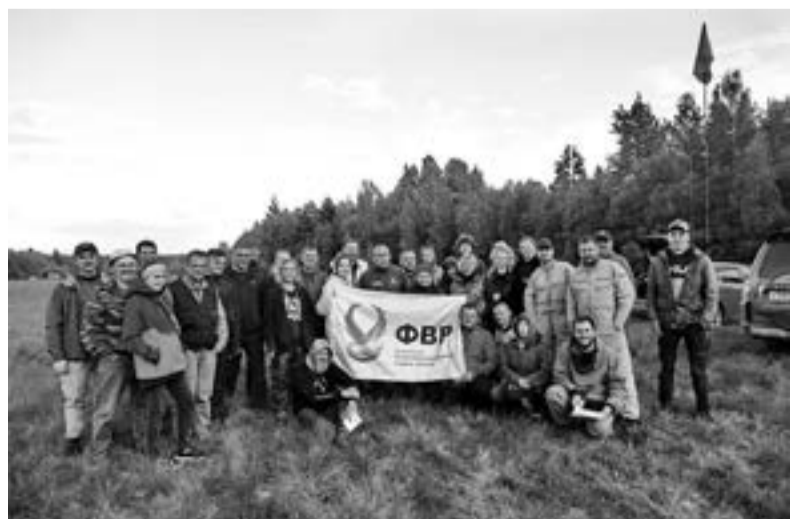
Соревнования собрали участников из Петербурга, Пскова, Московской и Ленинградской областей