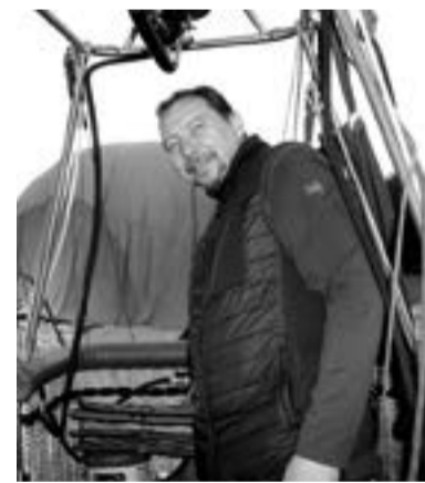
Вячеслав Ананских, глава Федерации воздухоплавательного спорта

Ну а ваша покорная слуга стала обладателем титула «графини Кривко» — по традиции человека, впервые совершившего полёт на воздушном шаре, посвящают в воздухоплаватели и присваи-