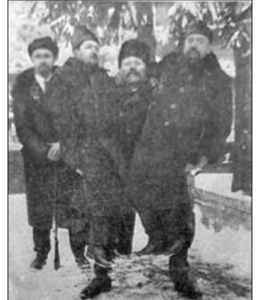
Фотография В.П. Веревкина, опубликованная в журнале «Огонек» в 1913 году

От своих родных я часто слышала о Куприне, который был завсегдателем трак-