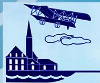
Гатчинский музей истории военной авиации

Поздравляет всех читателей газеты “Гатчина-ИНФО” и внимательно читающих наш “Авиахронограф” с Новым 2023 годом! Желаем всем здоровья, счастья и мирного неба над головой.