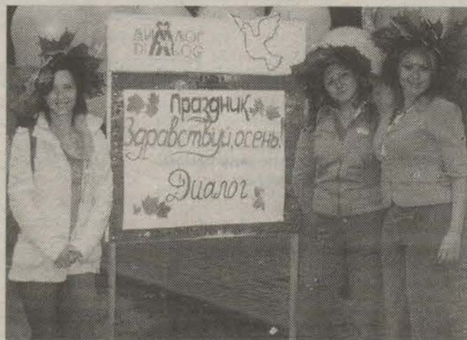
Праздник на Соборной «Здравствуй, осень»