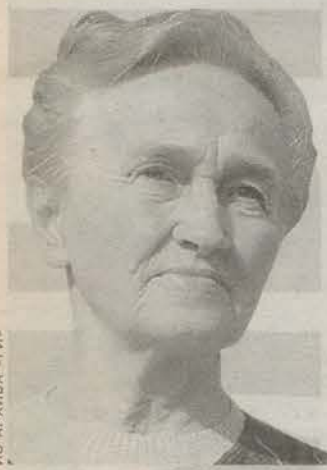
Родилась в 1939 году в Архангельской области. Предприниматель.

Вопрос следующего номера: 10 тысяч норков отпустили на свободу борцы за права животных. Происшествие случилось на выходных. Ночью группа неизвестных проникла на территорию зверохозяйства «Пионер» в Лужском районе, взломала клетки с животными и выпустила 30 тысяч зверьков (подробнее читайте на 4-й стр.). Как вы оцениваете действия борцов за права животных? *