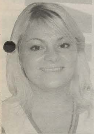
Родилась в 1981 году в Ленинграде. Закончила институт экономики и финансов. Операционист.

И я призываю всех: если Вы хорошо знаете свое дело и видите все его проблемы, для их решения грамотно обращайтесь в соответствующие инстанции, вплоть до Президента! Добивайтесь цели, наводите порядок в стране, не игнорируйте, а решайте проблемы. Не изображайте «молчание ягнят» — это преступно по отношению к России.