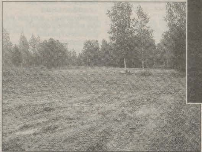
ФОТОГРАФИИ ИЗ АРХИВА

ШТАБ ПОИСКОВЫХ ОТРЯДОВ ГАТЧИНСКОГО МУНИЦИПАЛЬНОГО РАЙОНА