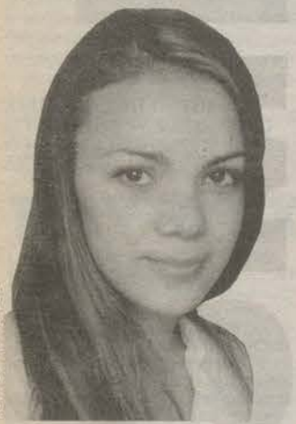
Родилась в 1984 году в Гатчине. Закончила Ленинградский областной институт экономики и финансов. Менеджер.

Нерешаемые проблемы — это проблемы, связанные со здоровьем. Есть некоторые болезни, которые не поддаются лечению, и вот здесь уже что-либо изменить человек часто оказывается бессильным. Все остальное — решаемо. Все, что можно купить за деньги, покупается; есть только проблема, где или как найти эти деньги или накопить их. В личной жизни тоже безвыходных ситуаций не бывает. Нужно только определиться с тем, кому что в этой жизни надо, и поступать согласно своим приоритетам. А без проблем жить невозможно — это жизнь.