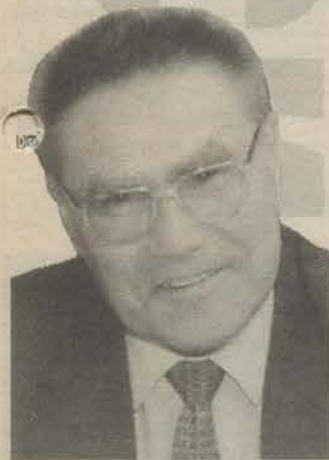
Родился в 1939 году в деревне Шпаньово Гатчинского района. Закончил инженерно-экономический институт. Заместитель председателя Совета депутатов города Гатчины.

Главное, чтобы все было хорошо продумано и организовано не только для VIP-персон, но и для рядовых петербуржцев.