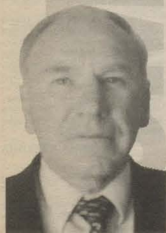
Родился в 1941 году. Закончил Пушкинский институт. Глава Елизаветинского сельского поселения.