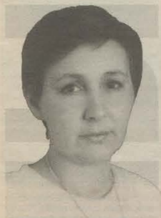
Родилась в 1959 году в Ленинграде. Учитель экономики и черчения школы № 2. Депутат МО «Город Гатчина».

Вопрос следующего номера: Каким Вы видите будущее мирового футбола, исходя из того, что происходило на чемпионате мира? Не кажется ли вам, что футболисты из азиатских и африканских стран, пока еще плохо владеющие техникой, но имеющие страстное желание победить, скоро потеснят европейских футболистов? *