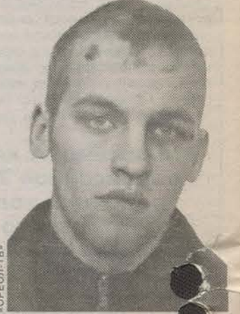
Молодой человек вырывал сумки у женщин в Гатчинском парке и в микрорайоне Аэродром.

Всех, кто опознал своего обидчика, стражи закона просят сообщить свою информацию по тел. 1-41-68, 2-23-20, 71-0-60 или 02.