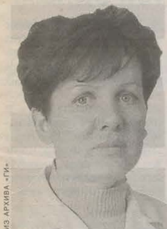
Родилась в 1961 году на Украине. Закончила Винницкий медицинский институт. Районный психиатр-нарколог.

Вопрос следующего номера: Как Вы оцениваете фильм «Дневной дозор»? Стоит ли он такой широкомасштабной рекламной кампании, которая была развернута? *