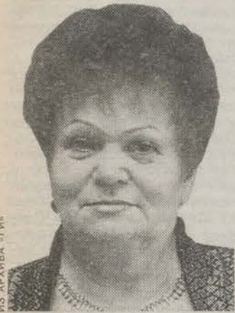
ИЗ АРХИВА «ГИ»