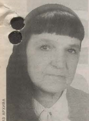
Родилась в 1937 году в Вологде. Закончила Ленинградский государственный университет им. А. Д. Жданова. Учитель Сиверской школы № 2.

Правильно проводимая экономическая и социальная политика, снижение уровня коррупционности современных чиновников поможет России повысить уровень и качество жизни населения.