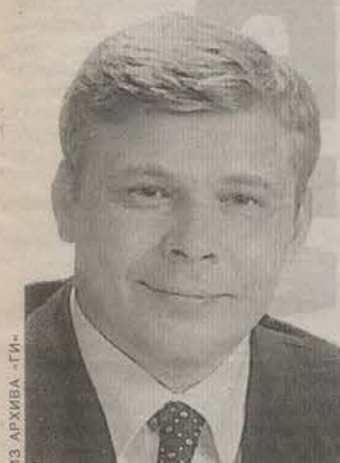
Родился в 1966 году в Гатчине. Руководитель фракции ЛДПР в Законодательном собрании Ленинградской области.