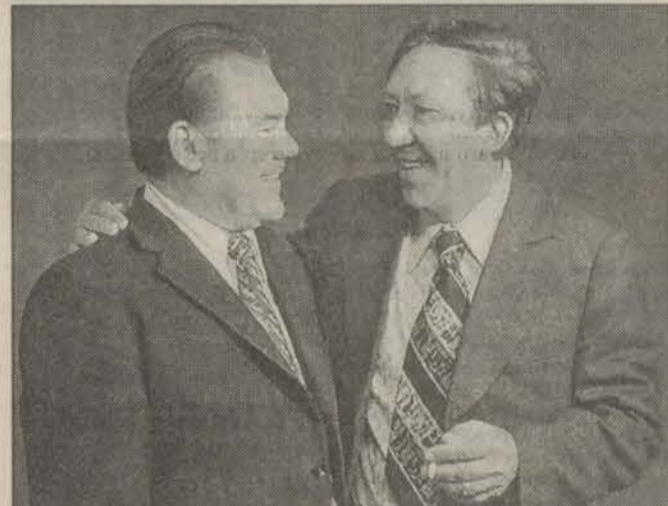
С Юрием Никулиным они дружили.

«Она увидела, что я еще шевелюсь, и начала на меня ложиться, я мысленно выругался матом и понял, что это — конец. Вдруг она остановила движение, и я рванулся из-под нее...».