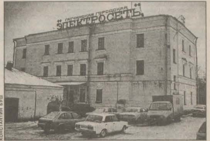
Лучшее предприятие России.

2001 год оказался для нашего города «урожайным» на победы. Главная — первое место Гатчины в областном конкурсе. Во всероссийском конкурсе из 1500 тысяч участников Ленинградской область заняла шесть призовых мест, три из которых достались