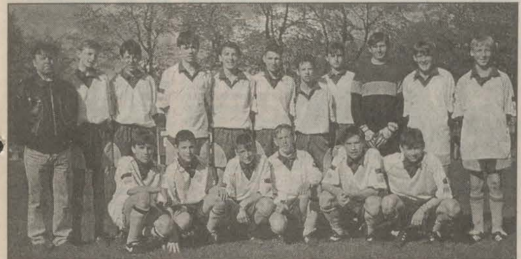
Победители чемпионата СПб, 1997 г.

Футбол — один из популярнейших видов спорта, и, конечно, в спортшколе его не смогли обойти вниманием.