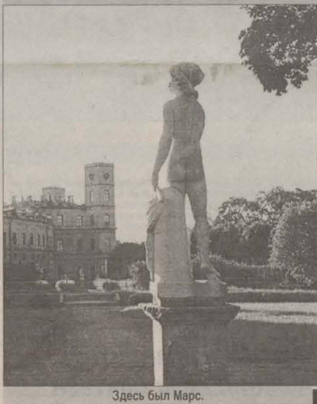
Здесь был Марс.

За день до проведения митинга общественности против прежнего директора гатчинского Дворца-музея ночью вандалы опрокинули и разбили статую молодого Марса в нижнем голландском садике. Сотрудники музея обнаружили разбитый памятник утром. В отличие от статуй, которые стоят в огороженном высокой решеткой собственном садике, Марс стоял открыто много лет подряд. И все-таки кому-то он сильно помешал. Теперь разбитый бог войны хранится под замком в отделе архитектуры дворца-музея. Скоро реставраторы займутся его восстановлением. Милиция завела уголовное дело, но вандалы пока не найдены. На поляне перед дворцом сиротливо стоят теперь уже три пустых постаментов.