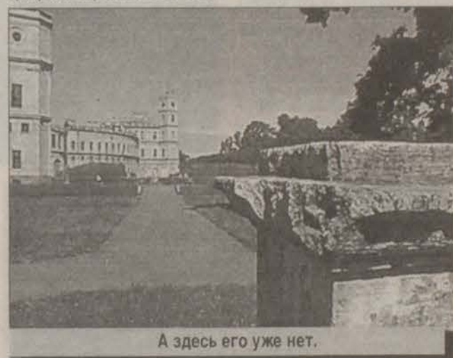
А здесь его уже нет.