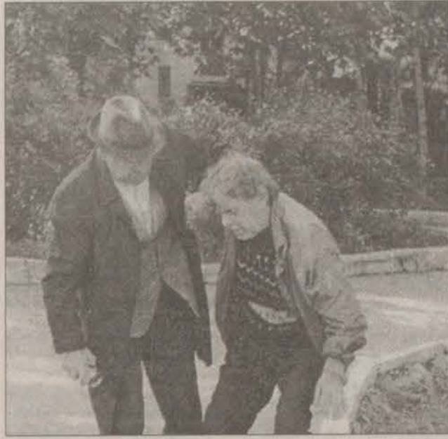
дам! Прошу делать ставки!

Матроны нехотя перешли от пересудов к игре. Ставки были сделаны. Играли на рубли, по 50 на ставку. Крупье безразлично крутил колесо рулетки. Вскоре стрелка замерла напротив ставки остроносой. Она жеманно хлопнула в ладоши, томно произнесла: