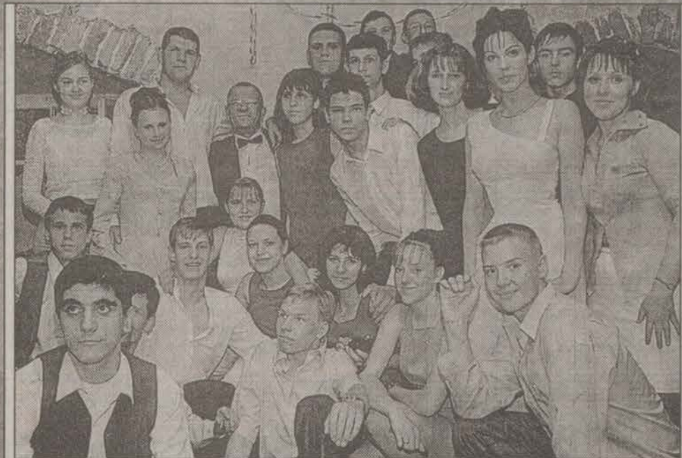
Учеба, учеба, учеба... экзамены, нервы, слезы, и... БАЛ ВЫПУСКНИКОВ!

Все! Аттестат в кармане, а дальше? Каков твой уровень притязаний?