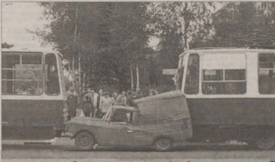
Государственная машина сомнёт любого