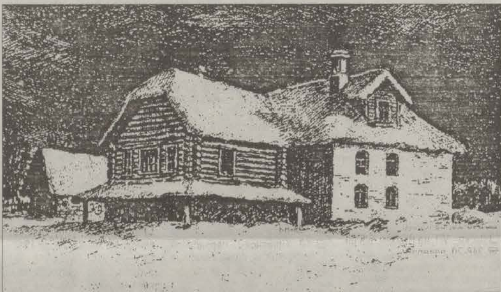
Суйда. Усадьба Ганнибалов. Рисунок художника А.Васильева 1954г.