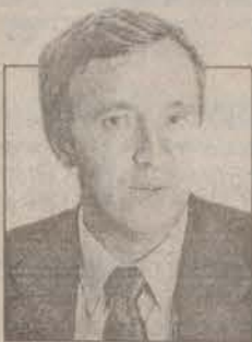
Владимир Павлович Вихров, первый заместитель главы города по экономике и финансам

ИСПОЛНЯЕТ обязанности Главы города на период его отсутствия (по приказу), подписывает от имени Главы города постановления и распоряжения по вопросам текущей деятельности администрации города, кроме вопросов, находящихся в исключительной компетенции Главы города, в отсутствие Главы города подписывает иные распорядительные документы в соответствии с действующим законодательством.