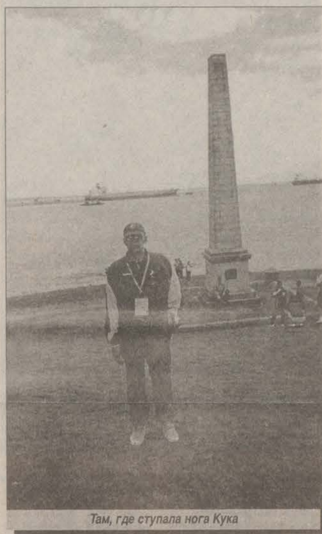
Там, где ступала нога Кука